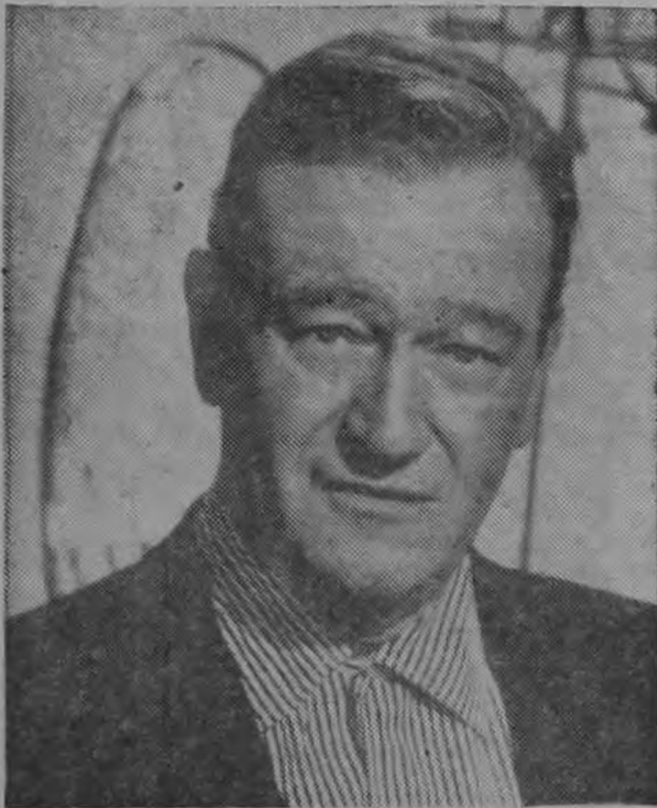
JOHN WAYNE recibió el Premio "Cecil B. DeMille Award" en reconocimiento por su labor en pro de la industria cinematográfica a través de los años en todo el mundo.