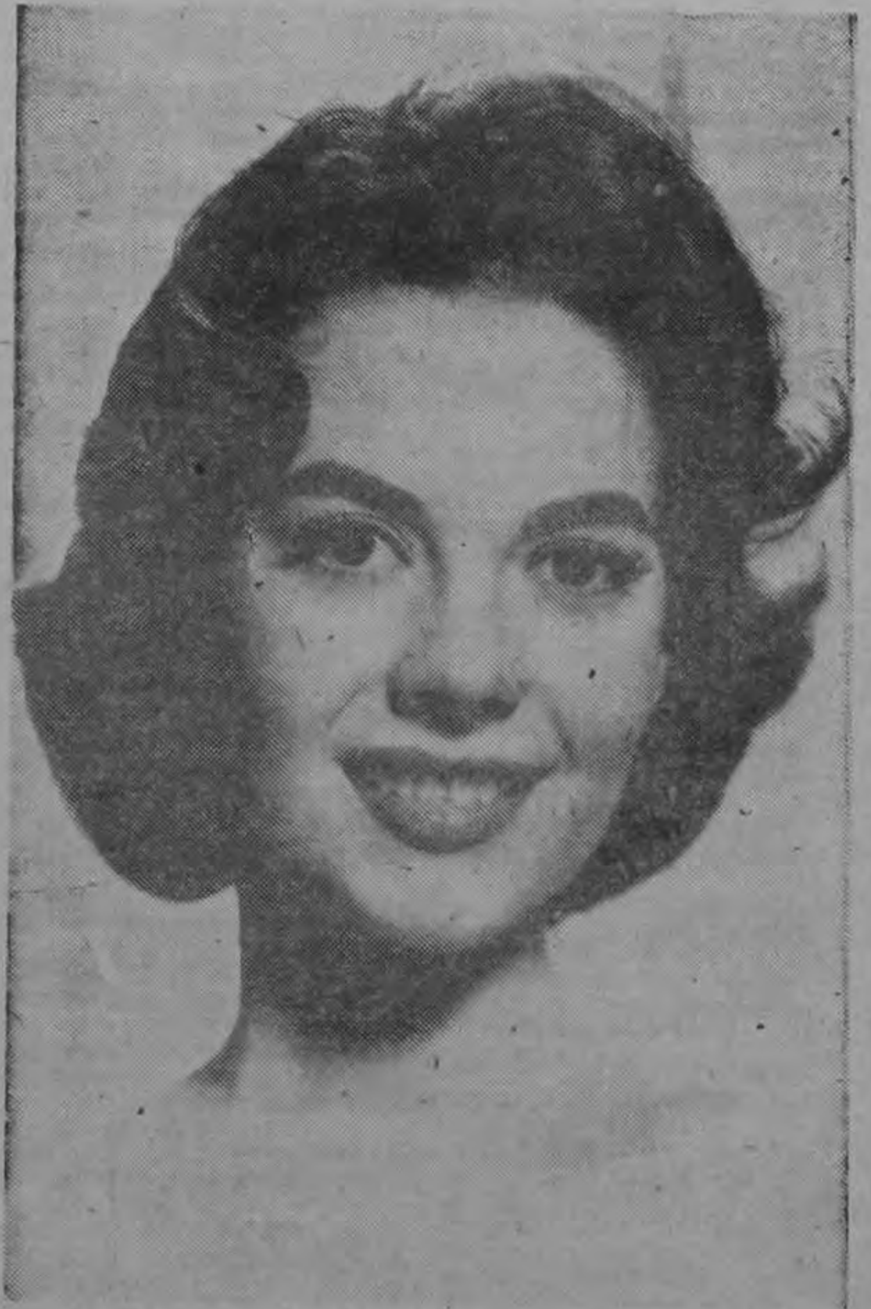
NATALIE WOOD fue declarada la actriz más popular del mundo. Un galardón bien merecido por su belleza, su simpatía e indiscutible capacidad artística.