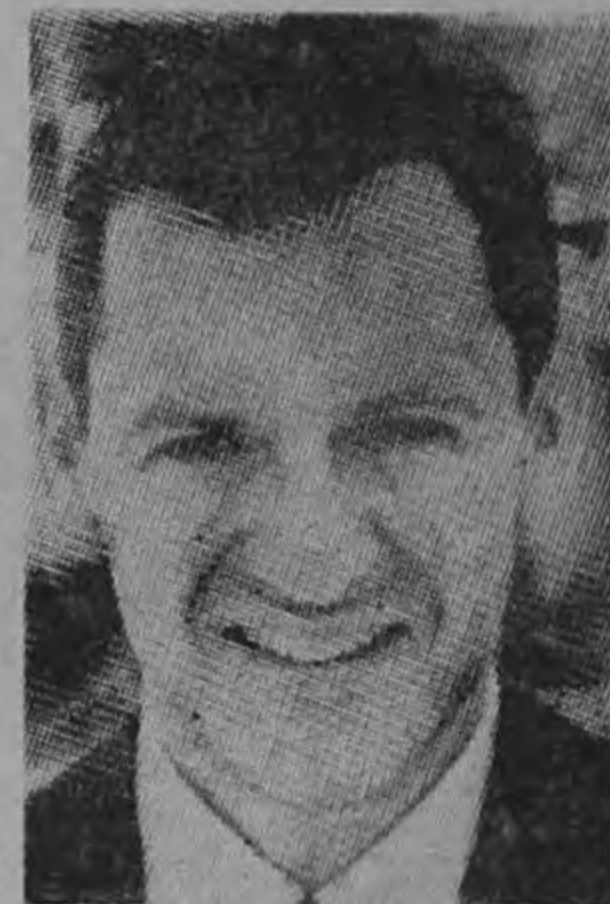
Tony Randall encarna a un hombre de ciencia que logra criar un león manso como un cordeiro en la hilarante comedia Universal en color "El Profesor y el León".