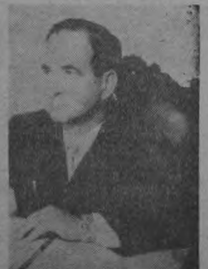
EX PRESIDENTE FIGUERES