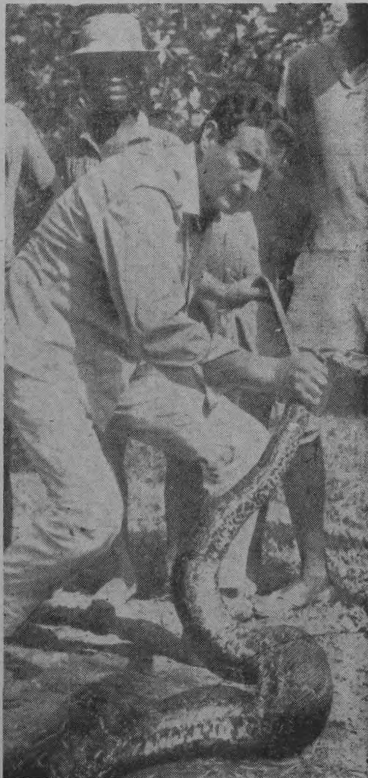
ARTURO FERNANDEZ, el gran actor español, en una apasionante escena de la película "PIEDRA DE TOQUE" (En un rincón de Africa)

La película más valiente y audaz del cine español