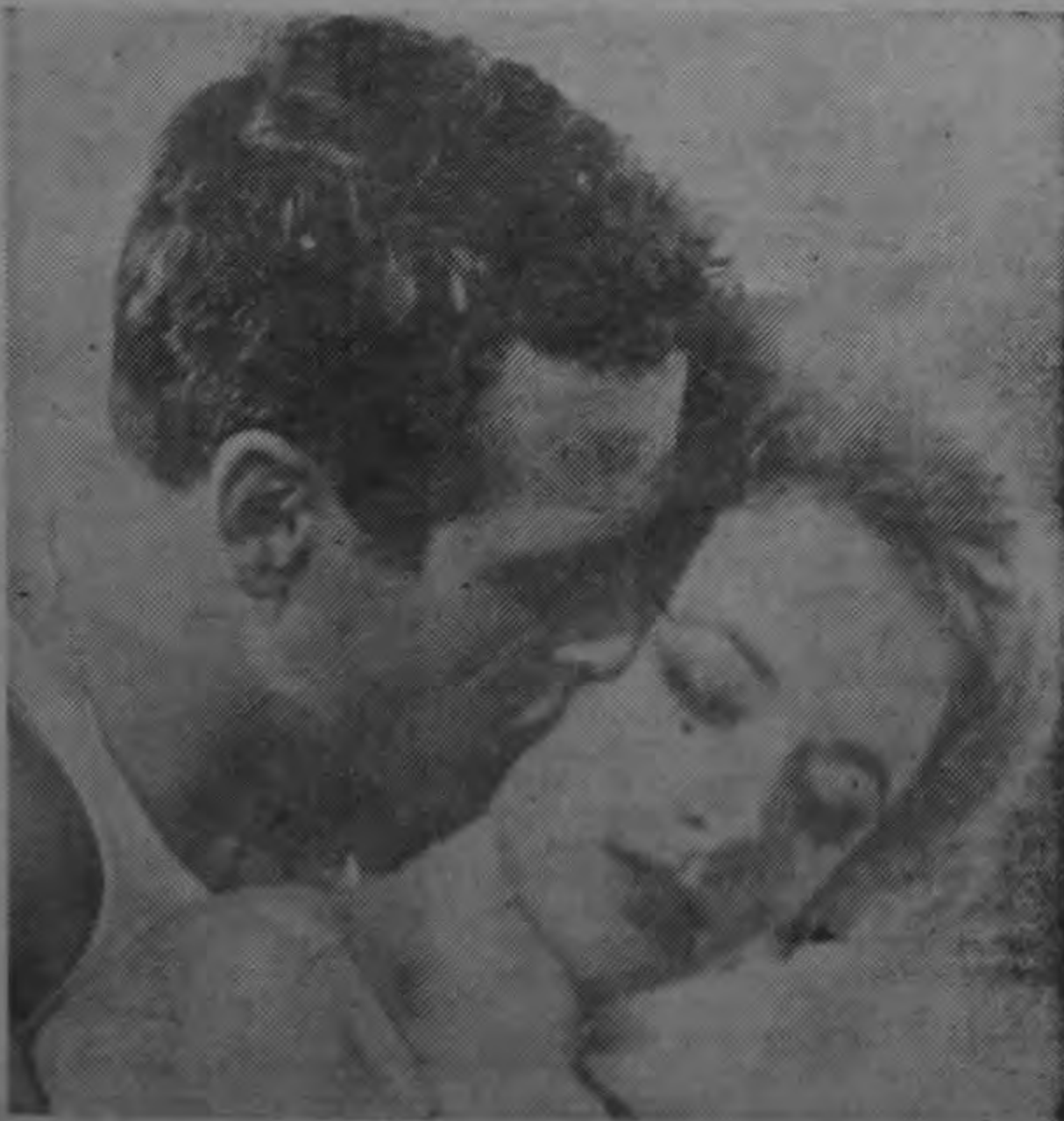
PAUL NEWMAN alcanzó la cumbre de la popularidad y recibió su "Globo" con todos los honores.