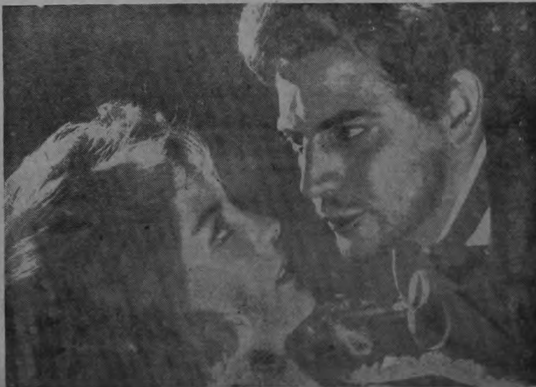
Vuelve a las pantallas la famosa obra de Pedro Antonio de Alarcón "El Escándalo". Una nueva versión de apasionante interés dramático con un importante repertorio.