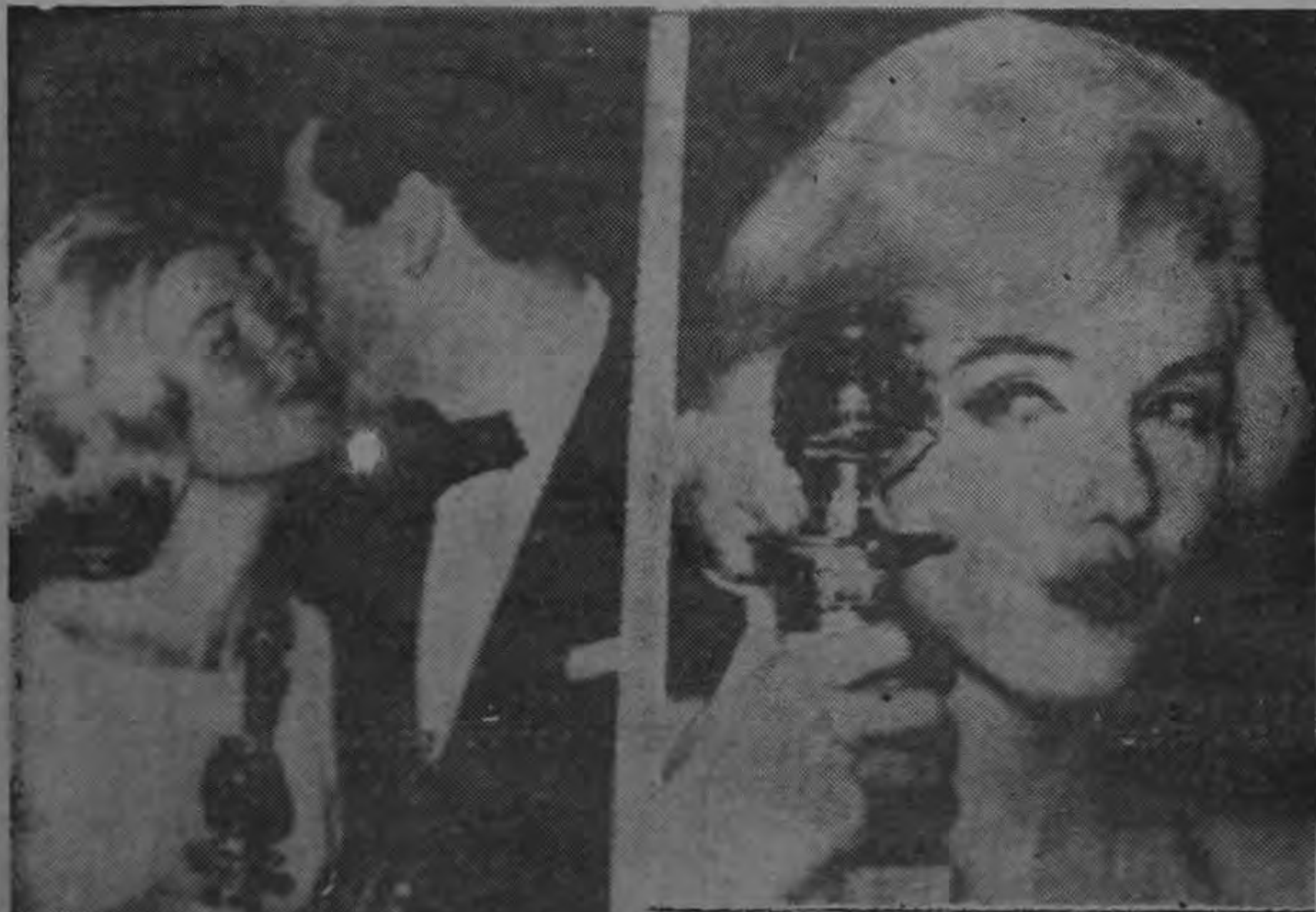
HOLLYWOOD: El actor Rock Hudson besa a Doris Day después de recibir el "Globo de Oro" como los mejores actor y actriz del mundo. En la otra parte vemos a la inolvidable Marilyn Monroe que recibió su "Globo" como la mejor actriz en comedia.

Nominaciones correspondientes a Columbia para el "Oscar" de 1965