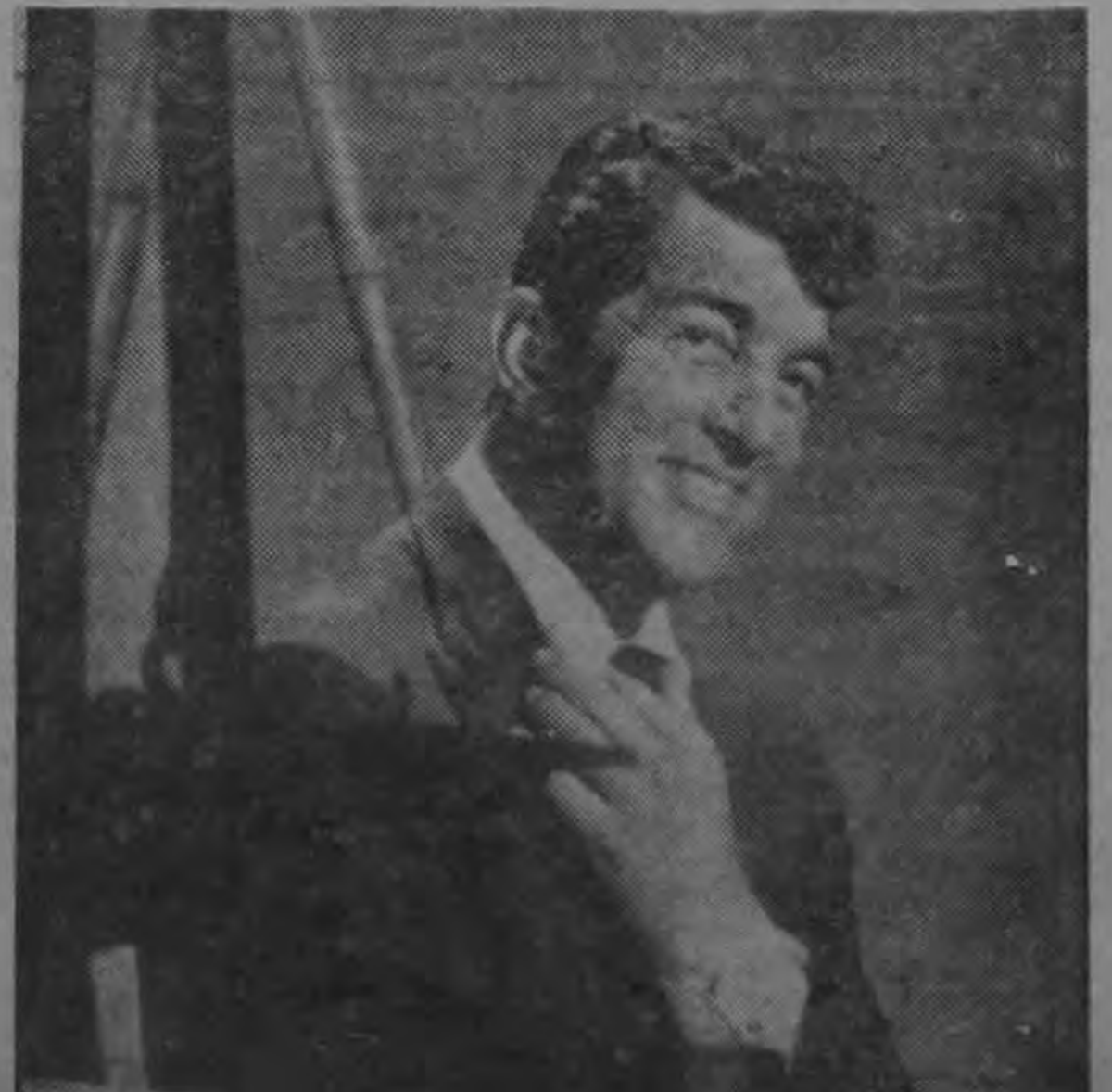
DEAN MARTIN también se hizo merecedor de tan valioso galardón por sus distinguidas actuaciones.